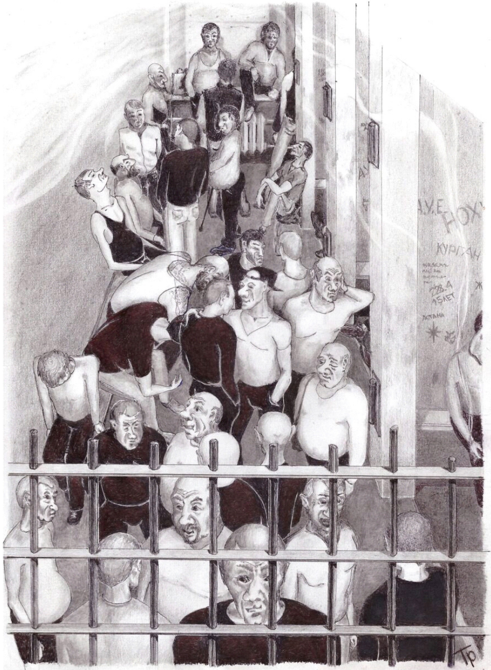
Рисунок 1. Сборка (работа автора).