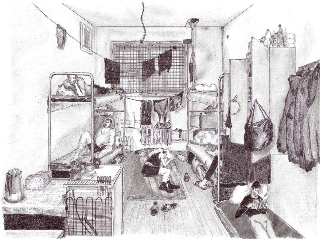
Рисунок 3. Хата (работа автора).